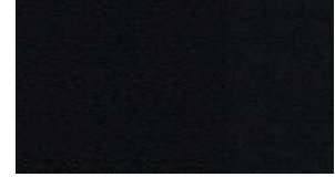
Обивка сидений чёрной кожей "Claudia" (CYFX)