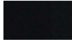
Обивка сидений чёрной кожей "Claudia" (CYFX)