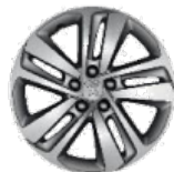
Литые алюминиевые диски 17" CURVE