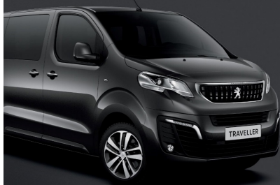
Gris Shark M. (9PM0)