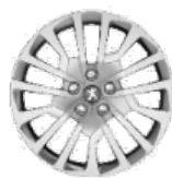
Колпаки штампованных стальных дисков 16" MIAMI