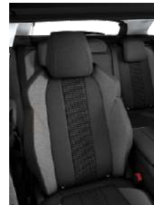
Темная ткань 'Месо'