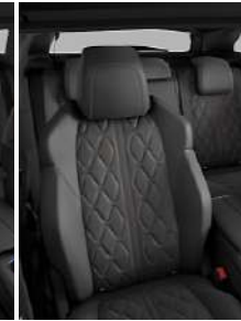
Темная натуральная кожа 'Narra' (перфорированная)