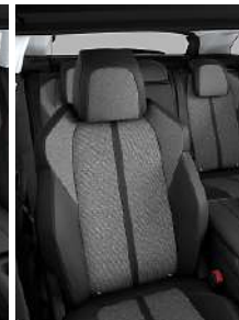
Темная искусственная кожа + ткань 'Piedimonte'