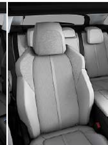
Светлая искусственная кожа + ткань 'Evron'