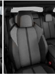
Темная искусственная кожа + ткань 'Imila'