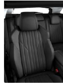
Темная натуральная кожа 'Claudia'